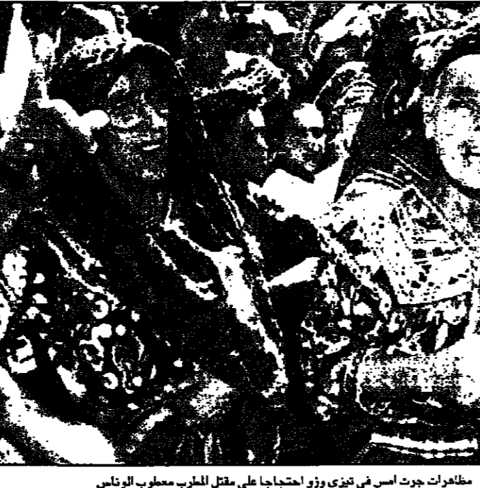
مظاهرات جرت اسر في جنيف وادخلت الى مقل المغرب مغلوب الرئاس